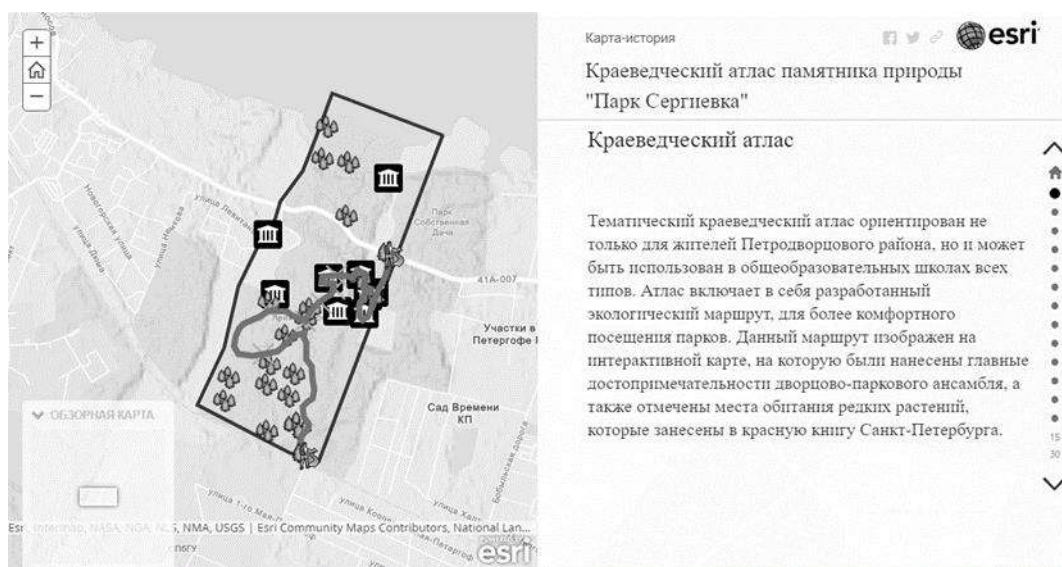
Рис.1 – Пример карты краеведческого атласа.

После проработки всех основных карт интерактивного атласа, был создан заключительный слой, на котором с помощью инструмента «линия» была нанесена экологическая тропа, которая объединяет все объекты между собой и в дальнейшем может служить в качестве эколого-просветительского маршрута.