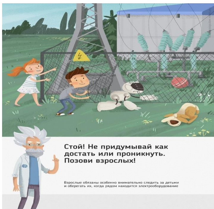
Рис. 5 Стой! Не придумывай как достать или проникнуть. Позови взрослых!