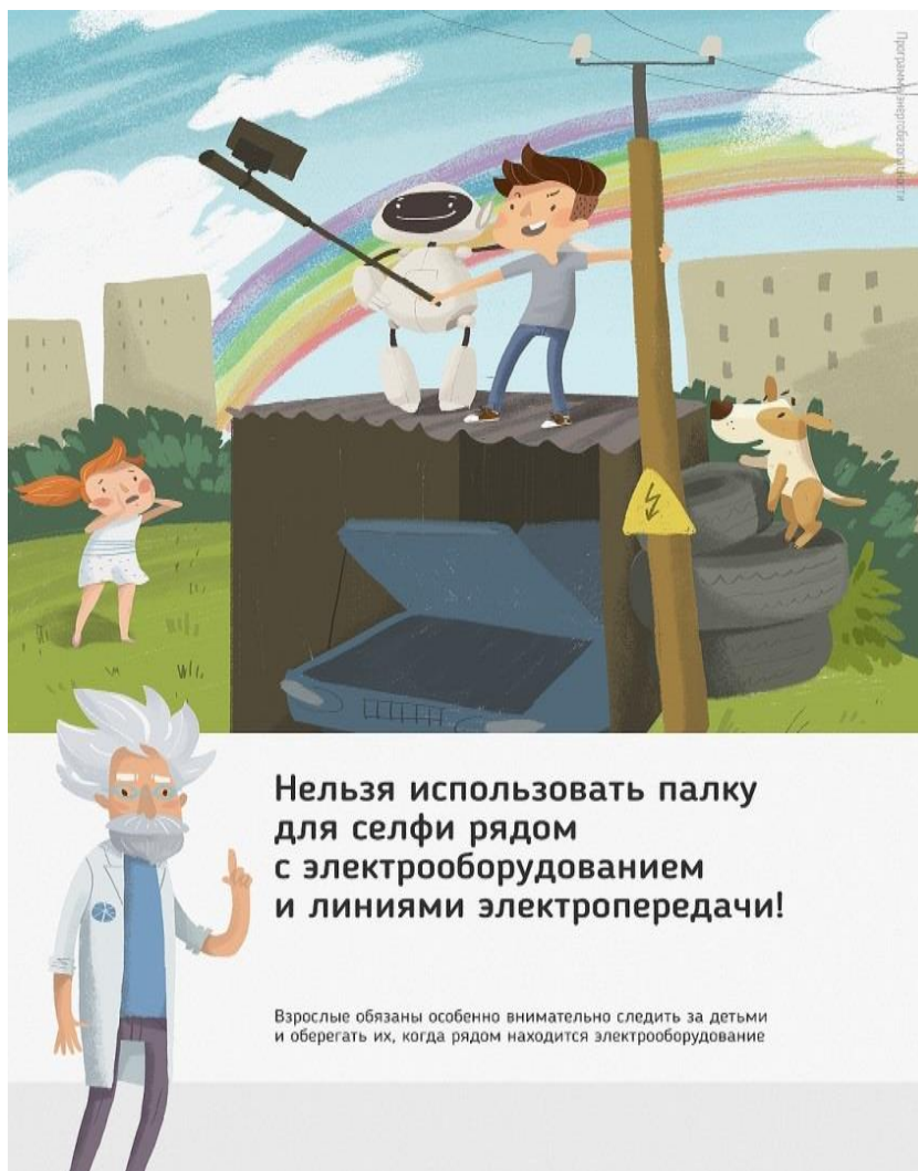
Рис 2. Нельзя использовать палку для селфи рядом с электрооборудованием и линиями электропередачи

Ну и, наконец, нужно повторить с ребенком алгоритм действий в экстремальной ситуации. Проверьте, умеет ли он набирать на сотовом телефоне телефон экстренных служб. Изучите с ним вещества и предметы, которые хорошо проводят электрический ток и потому особенно опасны, и, наоборот, вещества и предметы, плохо проводящие электрический ток и полезные в экстремальной ситуации.