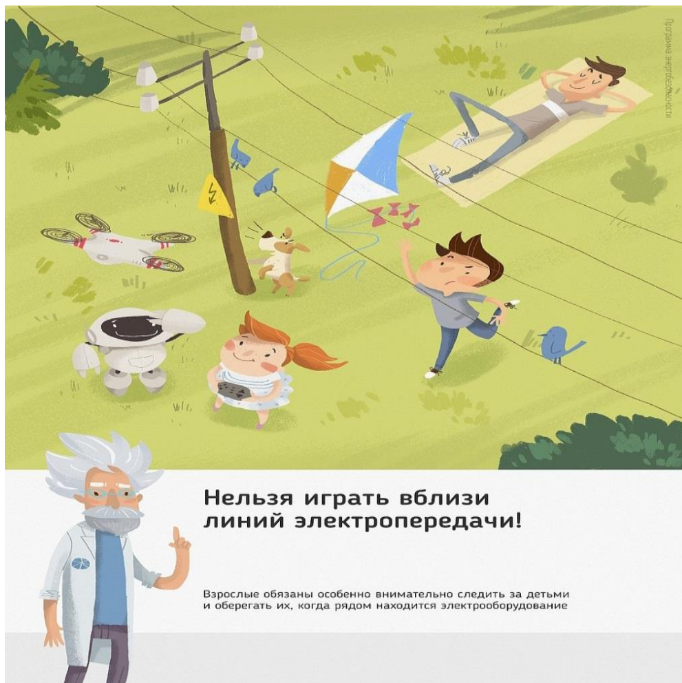
Рис.3 Нельзя играть вблизи линий электропередачи